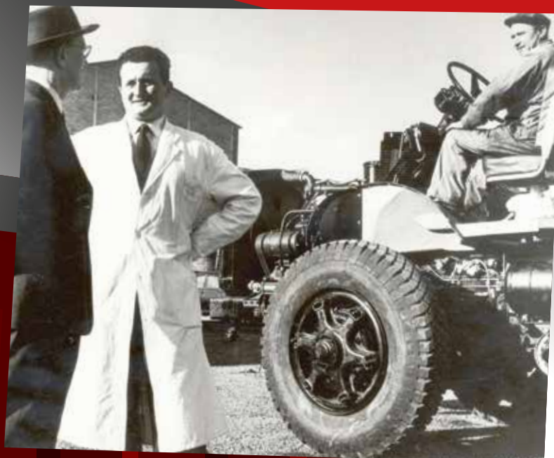
Centre d'essai de la Valbonne : texte à venir