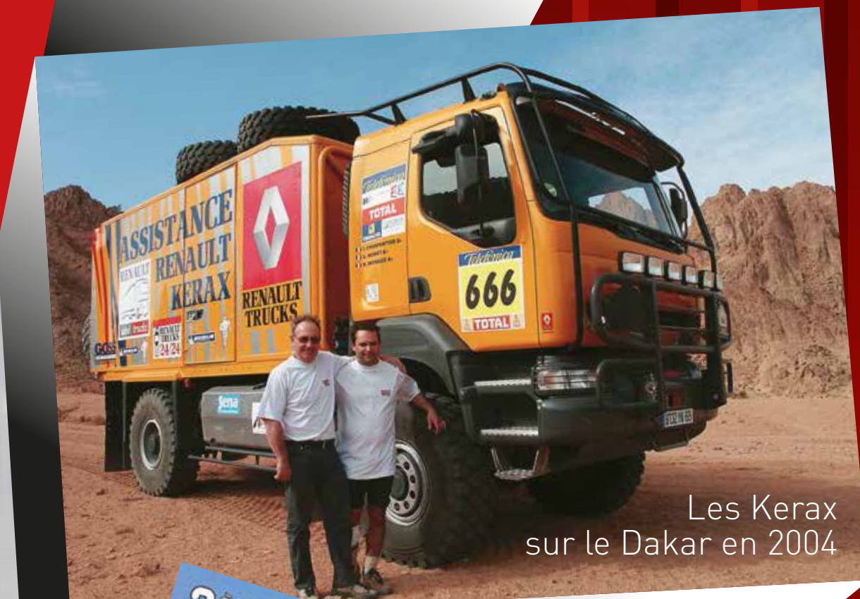
Les Kerax sur le Dakar en 2004