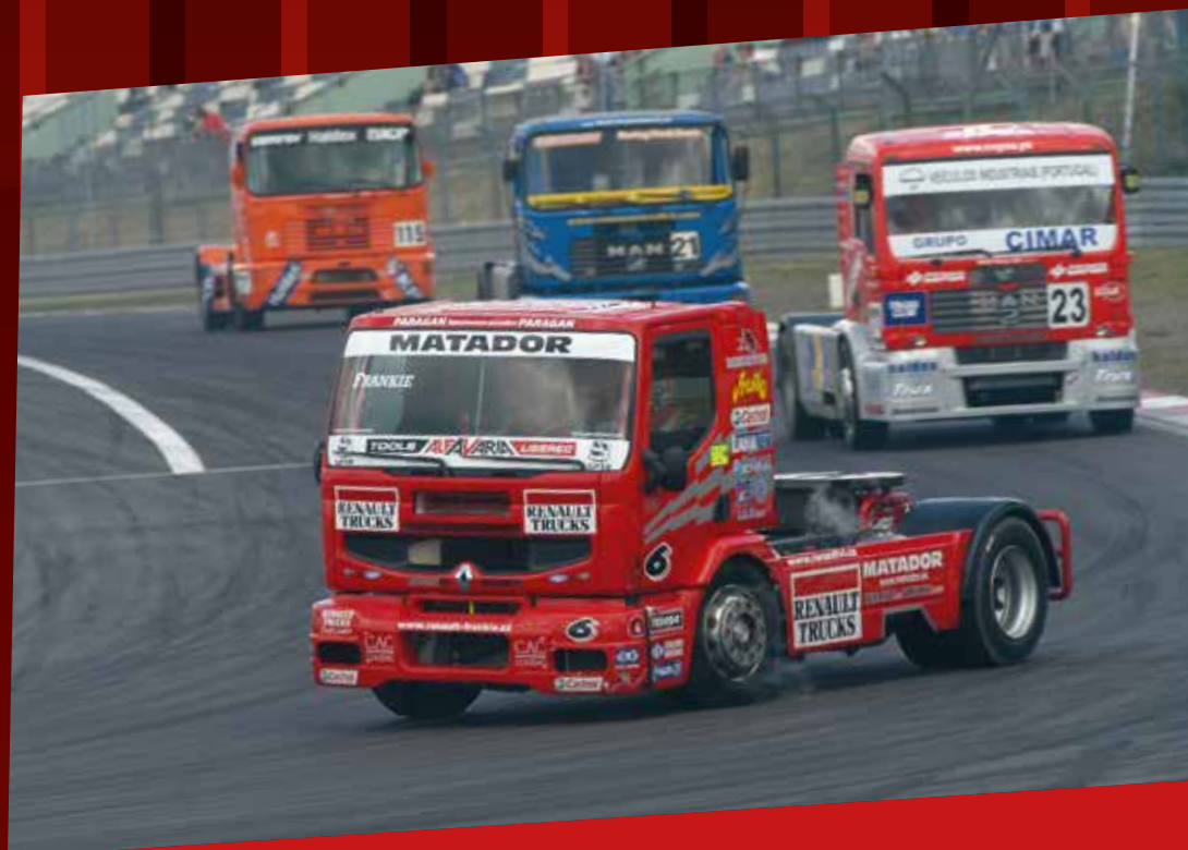
Les 24 h du Mans Camions en 1987