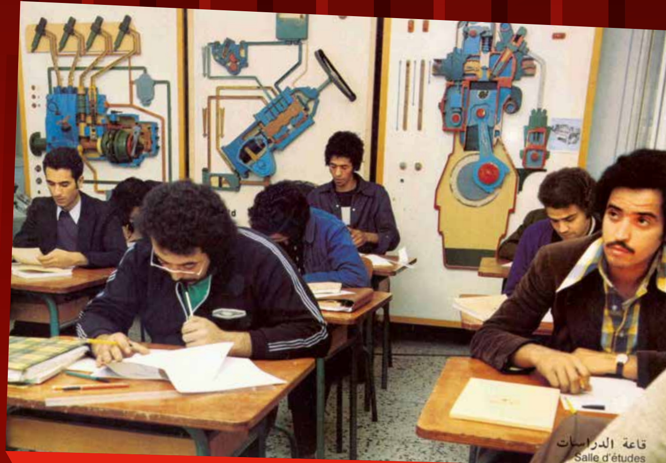
قاعة الدراسات Salle d'études

l'École technique Berliet, succède à l'École d'apprentis existant depuis 1912. Elle compte environ 400 élèves par promotion. Les diplômés sont assurés de trouver un emploi dans l'usine.