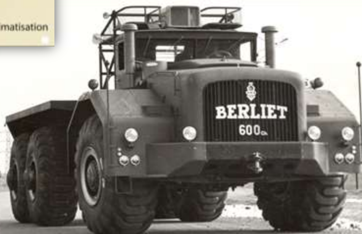
T100 n°2 6x6 - 1958

Poids total 103 Tonnes, longueur 15,30 m (après rallongement en 1958) hauteur 4,43 m – largeur 4,96 m