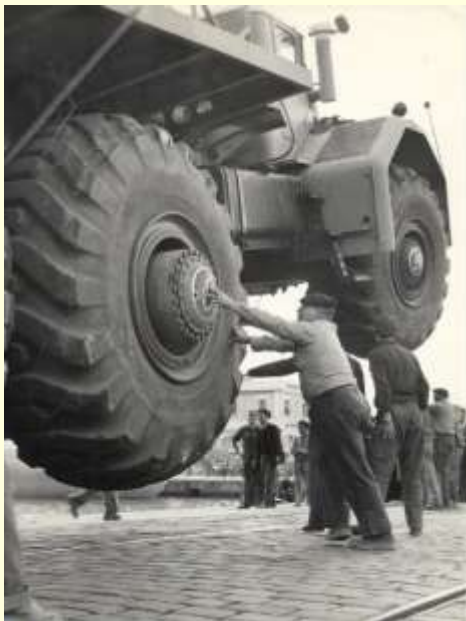
débarquement sur le port d'Alger

Après des essais et une démonstration en septembre 1958 sur le terrain du CELV (Centre d'Essais Militaires de la Valbonne), il est envoyé directement en Algérie.