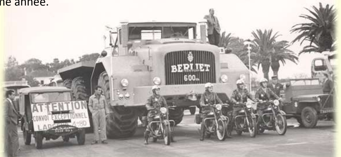
Alger : Le convoi au départ vers Rouïba

Arrivé à Alger le 10 octobre 1958, il est exposé à l'occasion de l'inauguration de l'usine Berliet de Rouïba, puis devant la succursale d'Oran en novembre de la même année.