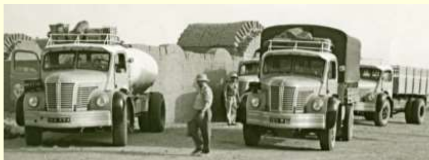
Berliet GLC et GLR8 de la Compagnie Saharienne Automobile à Fort-Flatters