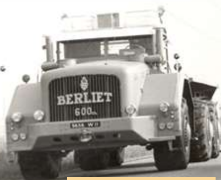
T100 n°1 6x6 - 1957

Consommation de gasoil : 90 litres/100 km - sur route 240 litres/100 km - sur sable