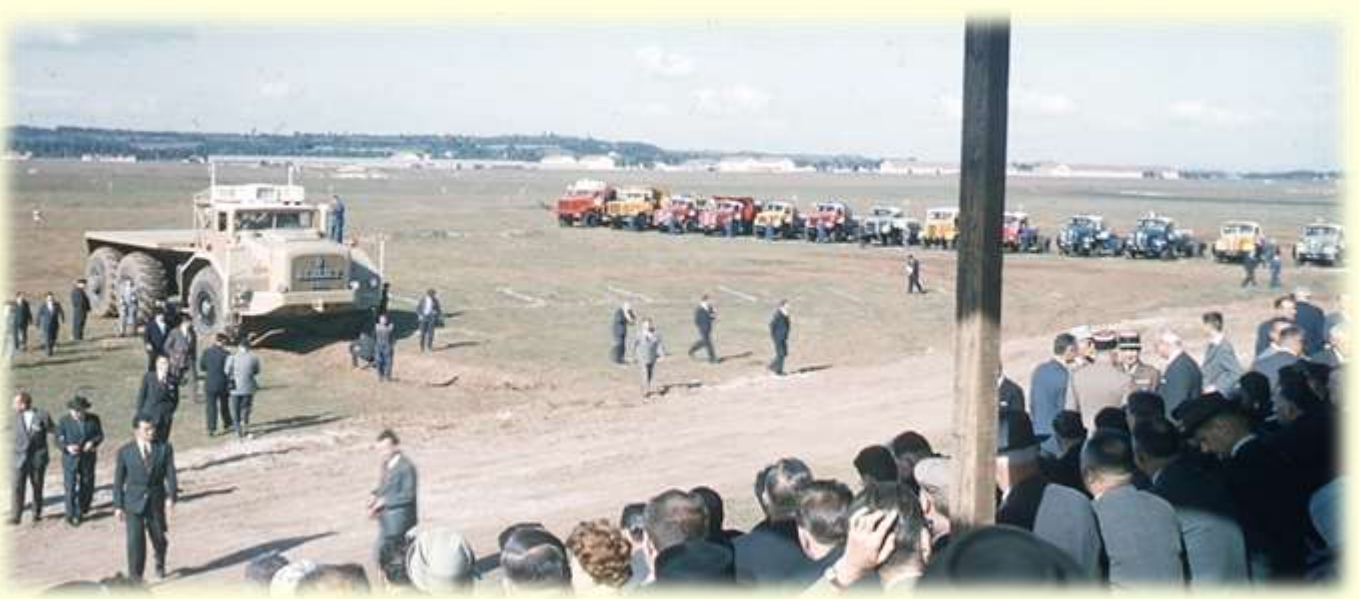
démonstration à la Valbonne, 26-9-1958